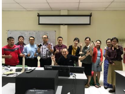
Bengkel Buku Step 2,3 Sibu 6 Ogos 2019