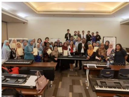
Bengkel Buku Step 2,3 Selangor 20 Ogos 2019