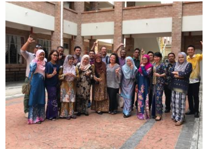
Bengkel Buku Step 2,3 Kuching 8 Ogos 2019