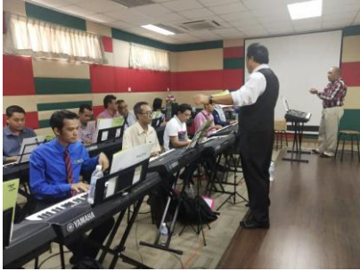
Bengkel Buku Step 2,3 Terengganu 15 Julai 2019