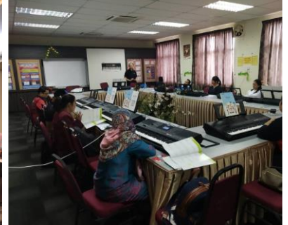
Bengkel Buku Step 3 Labuan 3 Sept 2019