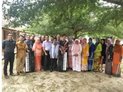
Bengkel Buku Step 2,3 Kelantan 24, 25 Julai 2019