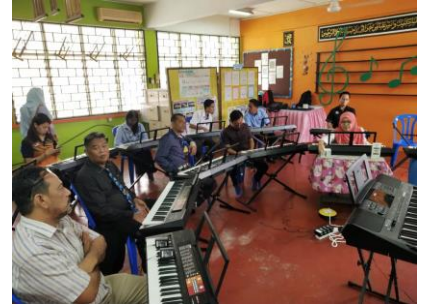
Bengkel Buku Step 1 Pahang 5 Ogos 2019