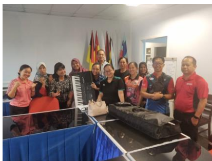
Bengkel Buku Step 3 Kota Kinabalu 5 Sept 2019