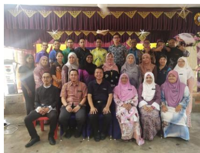
Bengkel Buku Step 2,3 Pahang 26 Sept 2019