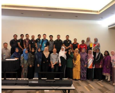
Bengkel Buku Step 2,3 Kuala Lumpur 22 Ogos 2019