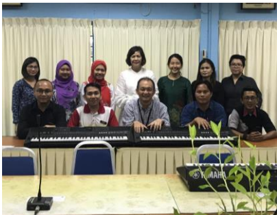
Bengkel Buku Step 2,3 Bintulu 5 Ogos 2019